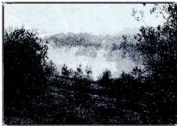
В окрестностях г. Читта делла Пьеве

Постоянно в Коммуне её члены не живут. Они собираются для конкретных дел, а, завершив их, разъезжаются по домам. В Коммуне с са-